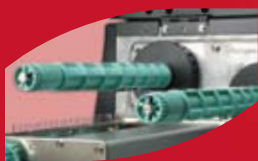
全創新碳帶軸模組